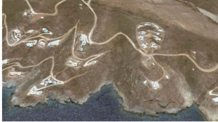
Εικ Ε1 Διάσπαρτη εκτός σχεδίου δόμηση ΝΔ της Κορησσίας

Η αναλογία παρόντος εποχικού προς μόνιμο πληθυσμό υπερβαίνει το 4:1 στην περίοδο αιχμής